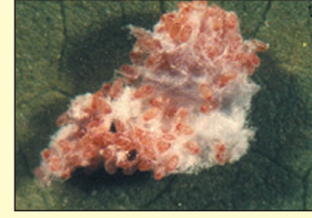
आ. ३ पिंग मिलीबगची अंडी

कापसारख्या पुंजक्यात साधारणपणे एका आठवड्यात 300 ते 500 अंडी घालते. मॅकोनेलीकोकस् हिरसुटस् मादीची अंडी नारिंगी रंगाची असतात. तर प्लॅनोकोकस् सिट्री मादीची अंडी पिवळसर पांढऱ्या रंगाची असतात. या अंड्यांमधून साधारणपणे पाच दिवसात पिळी बाहेर पडतात. पिळी अंड्यांमधून बाहेर पडल्यावर वेलीवर स्थिरावतात. ते वेलीमधील रस शोषण्यास सुरुवात करतात. मॅकोनेलीकोकस् हिरसुटस्ची पिळे नारिंगी रंगाची असतात तर प्लॅनोकोकस् सिट्रीची पिळी पिवळसर