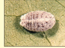
आ. ४ मिलीबगची मादी

पांढऱ्या रंगाची असतात. मिलीबगची मादी आणि नर पहिल्या काही अवंस्थामध्ये सारखेच दिसतात. मिलीबगची मादी तीन अवंस्थांमधून जाते तर नर चार अवंस्थांमधून जातात. मिलीबगचा नर कापसासारखी पिशवी तयार करतो आणि या पिशवीत हिवाळ्यात कोषावस्थेत जातो. प्रौढ नरस दोन पंख आणि दोन हाल्टर्स असतात. नर मिलीबग क्वचितच वेलीचे नुकसान करतो. मिलीबगची मादीच मोठ्या प्रमाणात वेलीचे नुकसान करते. मिलीबगचा जीवनक्रम साधारणपणे 30 दिवसांत पूर्ण होतो.