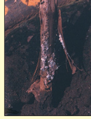
आ. १ सालीखालील मिलीबगची वसाहत

पिठ्या ढेकूण वेलीच्या बुंध्यातील ओलांड्यांतील, पानातील, फुलोऱ्यातील व घडातील रस शोषण करतात. आकृती क्र. १ मध्ये द्राक्षाच्या बुंध्याच्या सालीखालील वसाहत दाखविलेली आहे. मिलीबगचा प्रादुर्भाव वेलीच्या वाढीच्या टिकाणी झाला तर नवीन फुटीची वाढ खुंटते व या नवीन फुटीचे रुपांतर वेलीत न होती आकृती क्र. २ मध्ये दाखवल्याप्रमाणे U आकाराच्या आकडीत होते. पिठ्या ढेकूण व त्याची