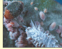
आ. ६ मिलीबगवर उपजिवीका करणारे लेडीबर्ड बीटल

ix. पावसाळ्यात (जून ते ऑगस्ट मध्ये) व्हर्टिसिलीयम लेक्यानी किंवा बिव्हेरिया बॅसियाना ( 2 \times 10^8 cfu प्रति मिली प्रति ग्रॅम) 5 ग्रॅम प्रति ली. या प्रमाणे पंधरा दिवसांच्या अंतराने एकदा फवारणी करावी.