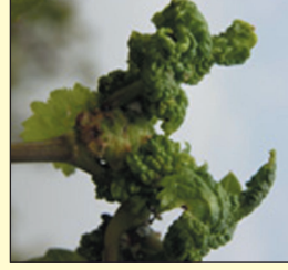
आ. २. मिलीबगचा प्रादुर्भाव असलेली पाने

पिठ्या स्वतःच्या शरीरातून मधासारखा चिकट पदार्थ बाहेर टाकतात. या चिकट पदार्थांमुळे पानावर, नवीन फुटीवर व घडांवर काळ्या रंगाची बुरशी वाढण्यास मदत होते. बुरशीने युक्त चिकट द्राक्षाचे घड आणि मिलीबगचा प्रादुर्भाव असलेले घड निर्यातीस, बेदाण्यास किंवा बाजारात पाठवण्यास लायक रहात नाहीत. या किडीमुळे द्राक्षा वेलीची वाढ खुंटते. नवीन वेलीवर मोठ्या प्रमाणात मिलीबगचा प्रादुर्भाव झाल्यास त्या मरतात. ज्या टिकाणी या किडीचा मोठ्या प्रमाणात प्रादुर्भाव झालेला असतो, तिथे 100% पर्यंत घट येते.